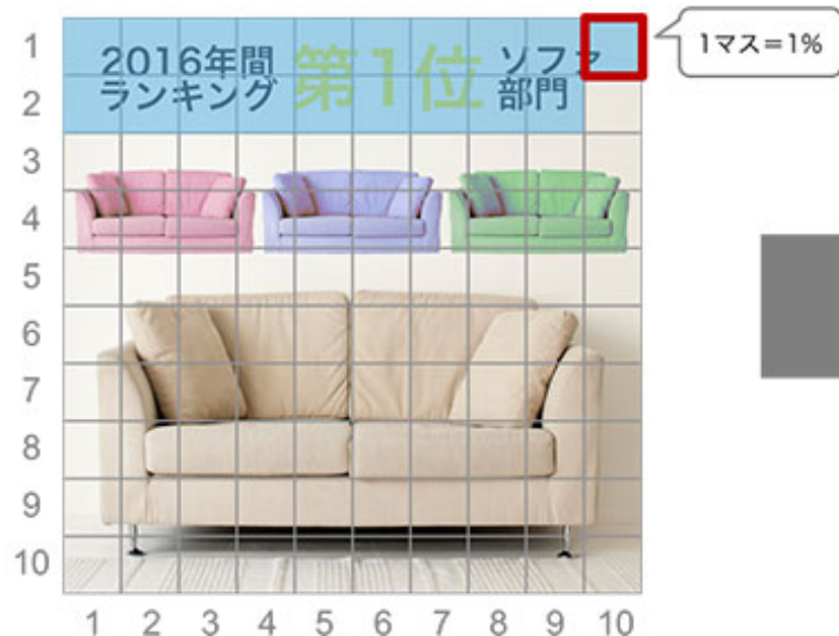
STEP2：テキスト要素占有率の算出