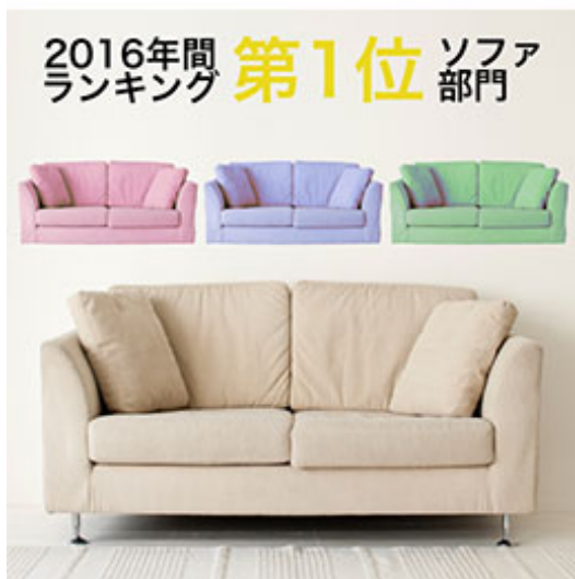
STEP1：登録する商品画像の準備