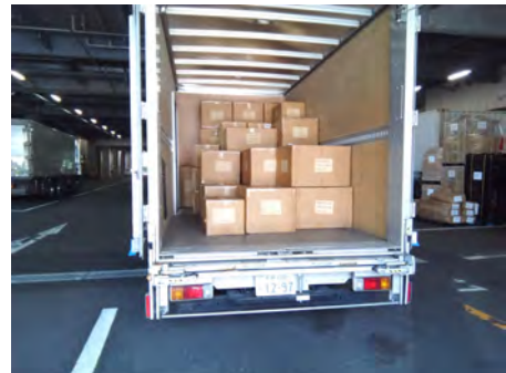
▲大井営業所 保税蔵置場 トラック側